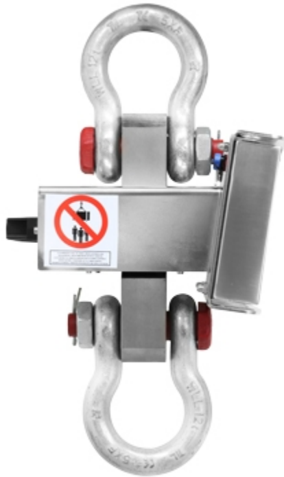
Dinamometro MCW09: vista laterale