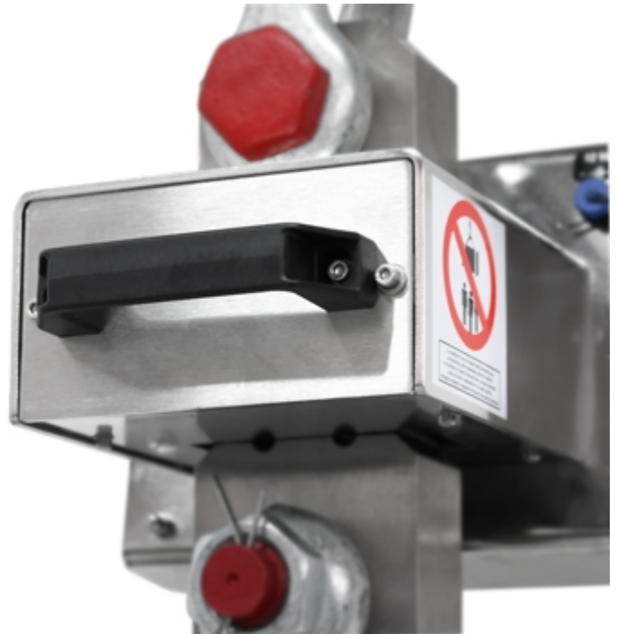
Dinamometro MCW09: dettaglio della batteria estraibile