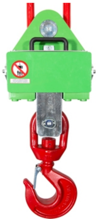
MCWHU: vista dal retro