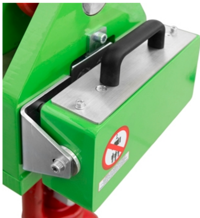
Pacco batteria ricaricabile estraibile di serie